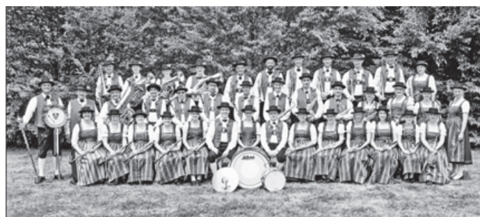
Musikkapelle Poing 2018