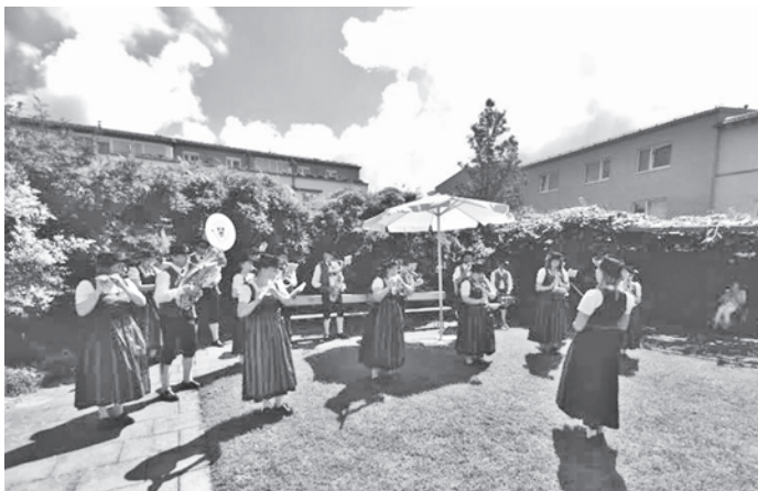
Standkonzert im Innenhof des Seniorenzentrums in Poing 2020

Startpunkt am Freitag ist bei der Osteria del Parco um 18.00 Uhr , weiter geht's dann beim Café Mainstreet um 18.30 Uhr, Oldies um 19.00 Uhr, Pizzeria La Piazzetta um 19.30 Uhr, vorbei am Onkel Ivo um 20.00 Uhr, bis wir dann an der Poinger Einkehr um ca. 20.30 Uhr das letzte Ständchen spielen.