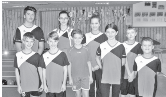
Jugend im Spielbetrieb

Das Jugendtraining hat mehr Fahrt aufgenommen als nach der langen Pause gedacht. Wir werden mit mindestens 3 Mannschaften einen eigenen Spielbetrieb organisieren. Evtl. können wir im Herbst sogar 4 Mannschaften stellen und dann einen noch besseren Spielbetrieb auf die Beine stellen. Freundschaftsspiele mit auswärtigen Mannschaften und eingebunden weitere Aktivitäten wie Klettergärten, Schifffahrten usw. sind derzeit in der Planung.