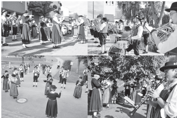
Eindrücke von unserer Tour durch Poing

Der nächste Auftritt lässt diesmal auch gar nicht lange auf sich warten, der Gartenbauverein Anzing feiert nämlich dieses Wochenende sein 125-jähriges Gründungsfest. Am Samstag den 17.07. dürfen wir hierbei abends ab 20 Uhr für die musikalische Unterhaltung sorgen und am Sonntag den 18.07. sind wir beim Festzug mit dabei. Wir freuen uns schon sehr darauf!