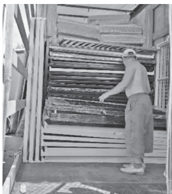
Die Bettgestelle werden in Gomel ausgeladen

Der LKW der Spedition Nyfeld fuhr zunächst nach Stuttgart, wo er mit den Bettgestellen und den Matratzen beladen wurde. Anschließend kam er nach Feldkirchen, wo die Ladung in den nächsten beiden Tagen von uns vervollständigt wurde.