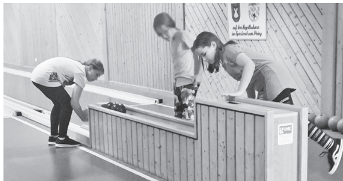
Jugend wartet ungeduldig auf die Kugeln

Immer mehr Kinder kommen zum Jugendtraining und diese Entwicklung ist doch sehr überraschend. Andere Vereine jammern über Mangel an Nachwuchs und wir haben nicht ausreichend Bahnen und Zeit um die Jugendlichen einzeln auf die Bahnen zu lassen. Bisher funktioniert das aber ganz gut und die Entwicklung macht Freude. Immer wieder kommen neue Kinder und wollen diesen schönen Sport testen. Im Kreis der anderen Jugendlichen macht das viel Spass und dann geht das Training viel leichter von der Hand.