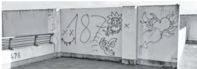
Seitenwände auf dem Dach des Park & Ride-Gebäudes

Hinweise bitte an die Gemeinde Poing/Baubetriebshof (Tel.: 22391-0) oder die Polizeiinspektion Poing (Tel.: 9917-0).