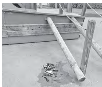
Schäden am Piratenspielplatz