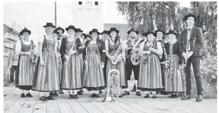
Bei unseren Standkonzerten durch Poing 2021

eine Zeit lang müssen wir noch warten, bis wir unseren Neujahrsvorstoß angehen können: endlich wieder für unser schon lange geplantes Konzert „Legenden“ zu proben und es auch aufzuführen! Die letzte Probe ist für unseren Geschmack schon wieder viel zu lange her und das letzte Konzert erst recht. Aber wir geben nicht auf, irgendwann schaffen wir das!