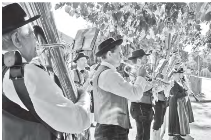
Bei unseren Standkonzerten durch Poing 2021

niges vor. Schauen Sie doch einmal auf unserer Website vorbei, unter https://www.musikkapelle-poing.de/Termine.php finden Sie unsere aktuell geplanten Termine.