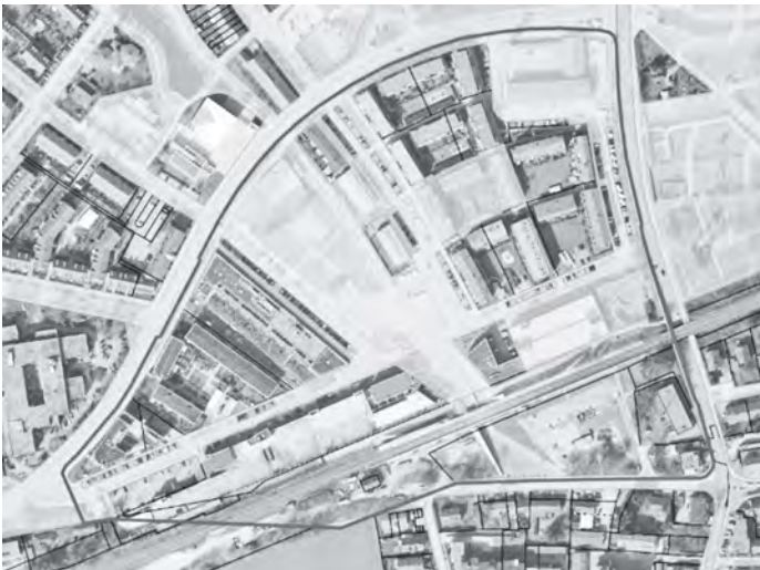
Umgriff der Verordnung der Gemeinde Poing zum Verbot des Verzehrs alkoholischer Getränke auf öffentlichen Flächen