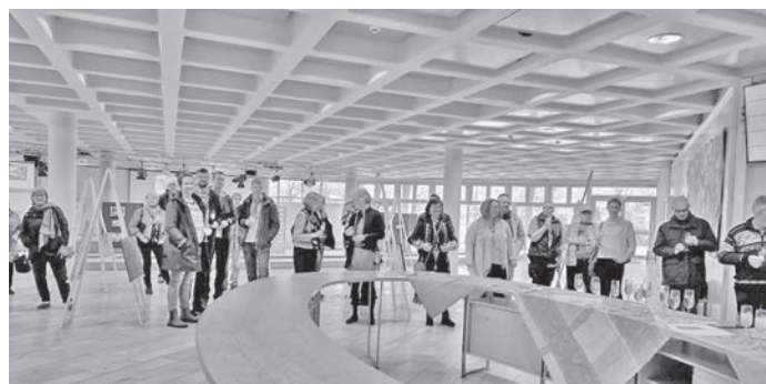
Künstler:innen und Besucher:innen der Vernissage

Letztes Wochenende hatte die Aktionsgruppe Respekt@Poing zur Ausstellung Solidarität in die Aula der Anni-Pickert-Schule eingeladen. Die Präsentation wurde gezeigt im Rahmen der Wochen der Toleranz, die das Katholische Kreisbildungswerk Ebersberg veranstaltete.