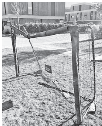
Fußballtor am Spielplatz „Schwanenstraße“

(lic) Zwei private Fußballtore müssen aus Sicherheitsgründen vom Spielplatz entfernt werden. Diese wurden vor geraumer Zeit aufgestellt, sind mittlerweile jedoch schadhaft und aufgrund dessen nicht standsicher. Sollten die Tore bis zum 24.11.2022 vom Eigentümer nicht entfernt werden, erfolgt eine Entsorgung durch den Baubetriebshof Poing.