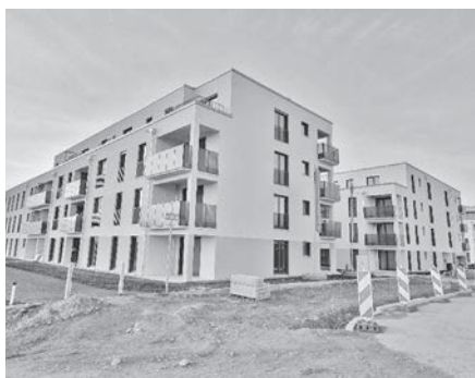
Die sechzig neuen geförderten Wohnungen der Südhausbau im Westen des Lerchenwinkels

Unterstützt werden diese Ziele durch eine entsprechend ausgerichtete Bauleitplanung und Bodenordnung, durch vertragliche Regelungen und auch durch beachtliche kommunale Zuschüsse , die neben der öffentlichen Förderung oft unumgänglich sind.