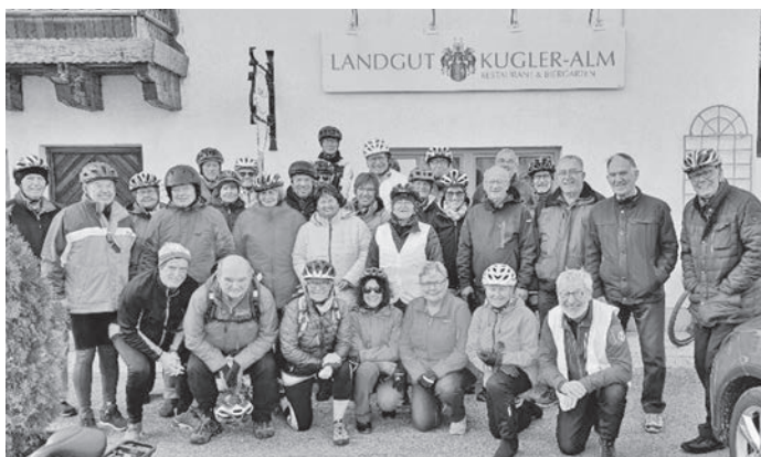
Die Poinger Seniorenradler vor dem Landgut Kugler-Alm in Aßlkofen

tigen. Entsprechend locker und gut war die Stimmung. Damit haben wir heuer bei den zehn Radltouren insgesamt immerhin 558 km und 2.070 km zurückgelegt.