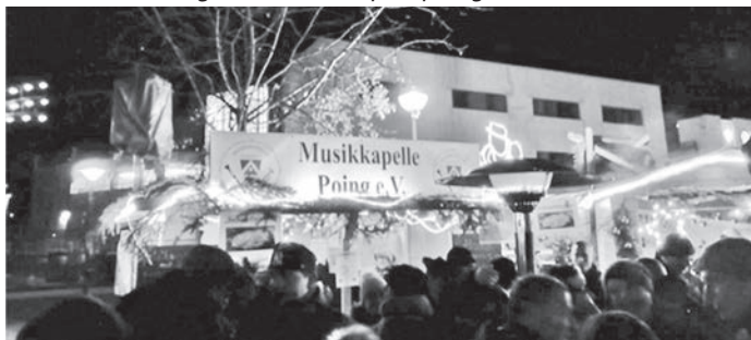
Unser Stand beim Christkindlmarkt 2019

Follow us on Instagram @musikkapellepoing