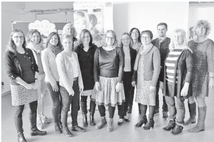
Referenten der Karl-Sittler-Grundschule Poing, des KERN, des Sozial- und Kultusministerium und der beiden Vernetzungsstellen Kita- und Schulverpflegung Oberbayern Ost und West