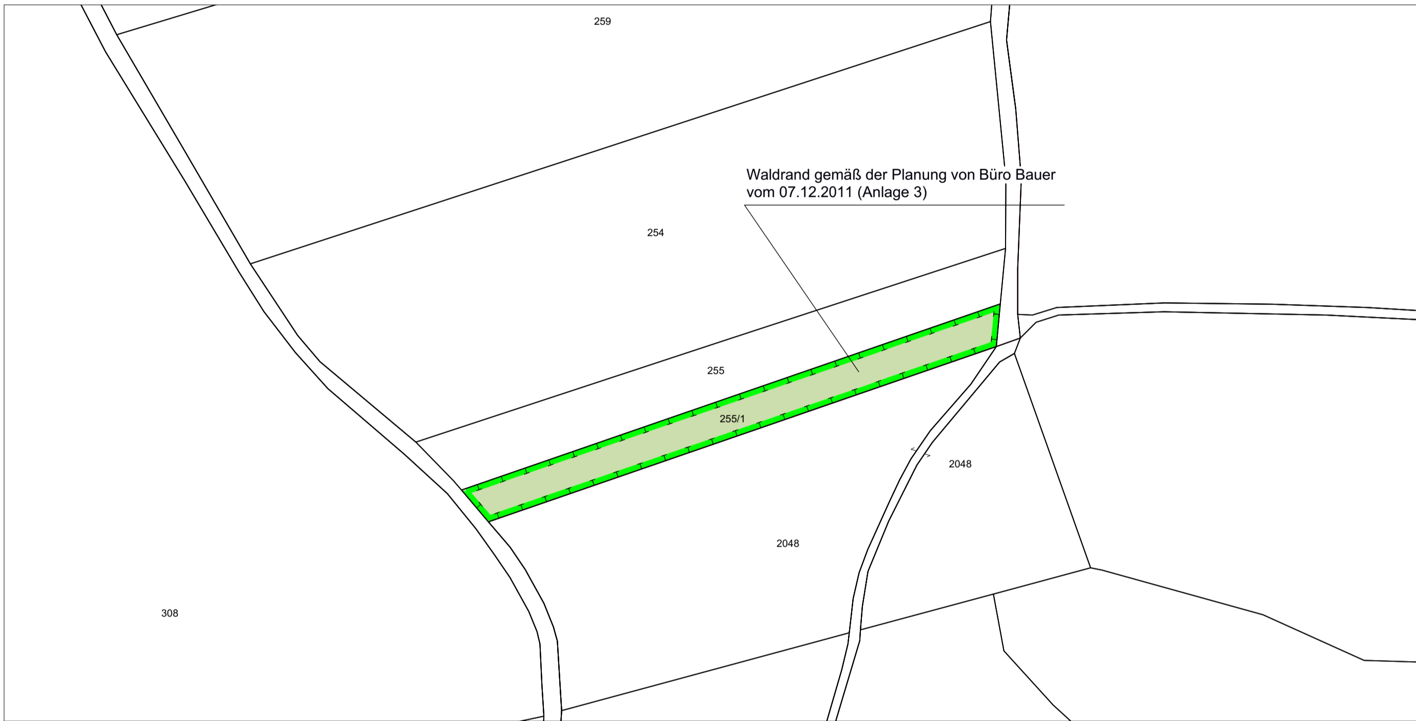
Ausschnitt A _ Fl.-Nr. 255/1, M 1:1.000