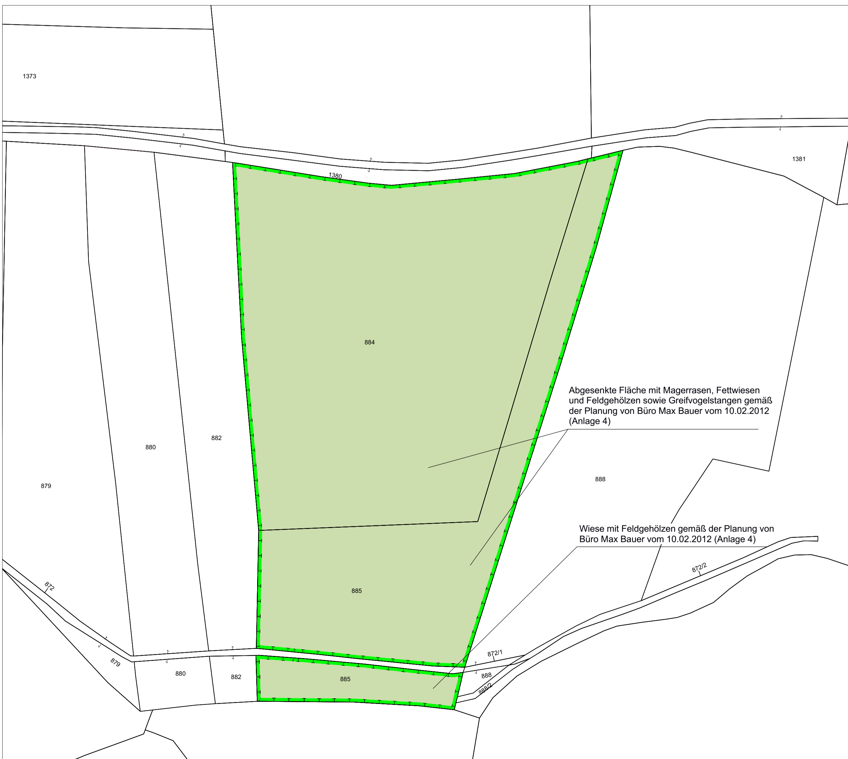
Ausschnitt B _ Fl.-Nr. 884 und 885, M 1:1.000